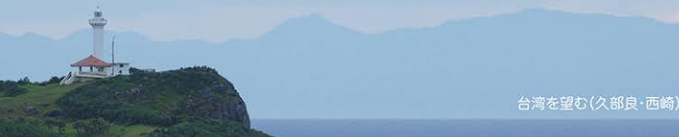
台湾を望む(久部良・西崎)