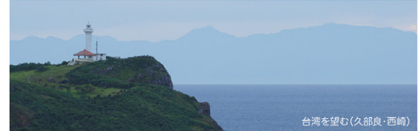
台湾を望む(久部良・西崎)