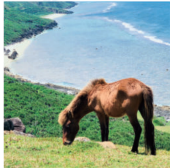
与那国馬(ヨナグニウマ)

与那国島の在来馬で体高が110～120cm、体重は約200kgと小型の馬です。また日本在来馬8馬種のひとつで、与那国町の天然記念物に指定されています。 与那国馬は昔から人と共に暮らし、重い荷物を背中に載せて一緒に働いてきました。現在は車や機械が入ってきたため役割が変わり、観光はもちろんだ医療や福祉の分野で昔と変わらず良きパートナーとして大切にされ活躍しています。 優しく人懐こい性格の与那国馬は、やすらぎを与え子供から大人まで楽しませてくれます。