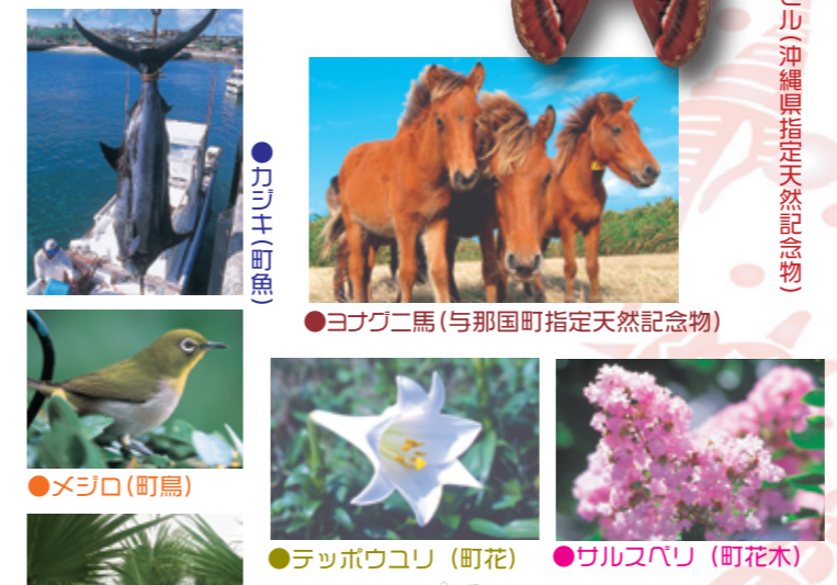
アヤミハヒル (沖縄県指定天然記念物)